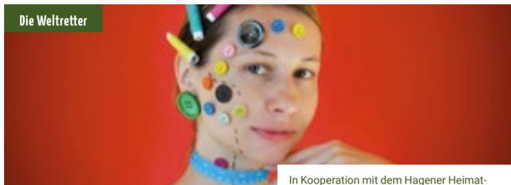
In Kooperation mit dem Hagener Heimatbund & VHS Hagen

Ort: AllerWeltHaus Hagen Kosten: Pay what you want Anmeldung: 02331 - 207 3622, vhs@stadt-hagen.de, Kurs 1405B