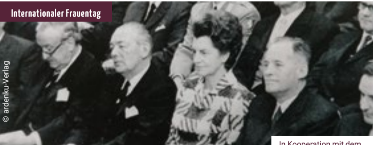
In Kooperation mit dem Hagener Heimatbund