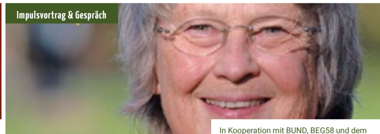
In Kooperation mit BUND, BEG58 und dem Klimabündnis Hagen

Ort: AllerWeltHaus Hagen Kosten: Eintritt frei