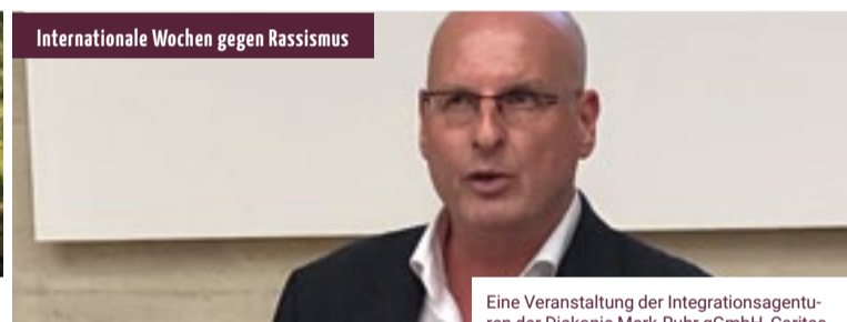
Eine Veranstaltung der Integrationsagenturen der Diakonie Mark-Ruhr gGmbH, Caritas Verband Hagen und AWO UB Hagen - Märkischer Kreis

Ort: AllerWeltHaus Hagen Kostenfrei, Anmeldung erbeten. Anmeldung: 02331 - 21410, kira.koeller@allerwelthaus.org