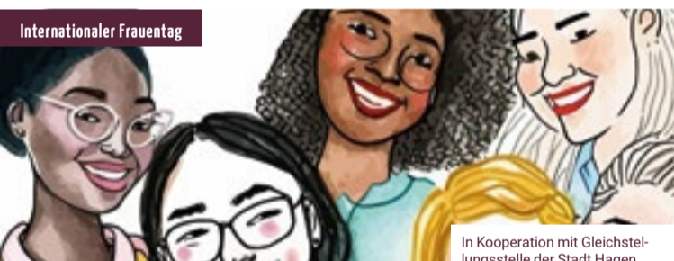
In Kooperation mit Gleichstellungsstelle der Stadt Hagen und Frauennetzwerk Hagen

Spendenkonto: DE37 4505 0001 0103 0230 03