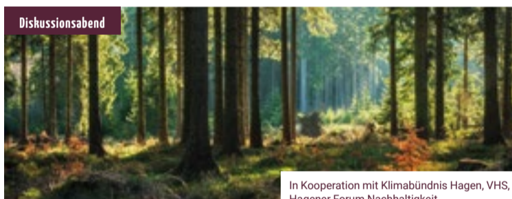
In Kooperation mit Klimabündnis Hagen, VHS, Hagener Forum Nachhaltigkeit, Emil-Schumacher-Museum

Ort: AllerWeltHaus Hagen Kosten: Pay what you want Anmeldung: 02331 - 207 3622, vhs@stadt-hagen.de, Kurs 1425B