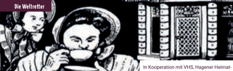
In Kooperation mit VHS, Hagener Heimatbund, FernUniversität, Koloniale Kontinuitäten überwinden