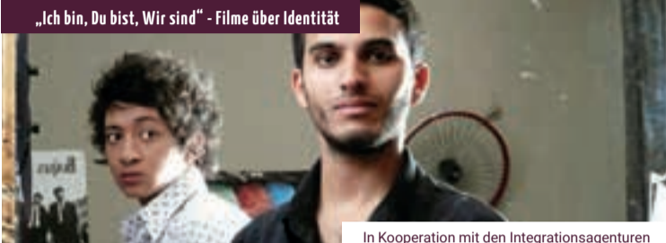
In Kooperation mit den Integrationsagenturen der Caritas Hagen und der AWO UB Hagen – Märkischer Kreis & Kino Babylon