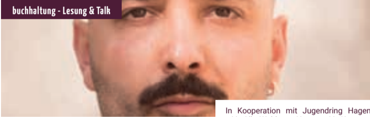
In Kooperation mit Jugendring Hagen e.V., AllerWeltHaus Hagen e.V., Kommunales Integrationszentrum der Stadt Hagen, Integrationsagentur der Caritas, Integrationsagentur der Diakonie Mark Ruhr, Stadtbücherei Hagen.