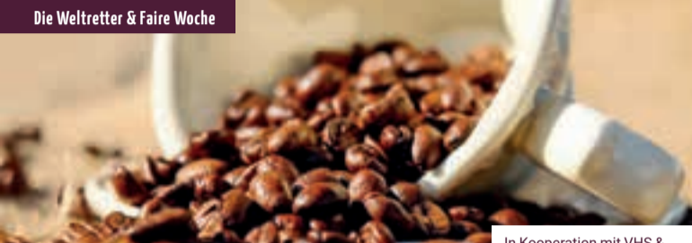
In Kooperation mit VHS & Hagener Heimatbund

Kosten: Museumseintritt, keine zusätzlichen Kosten