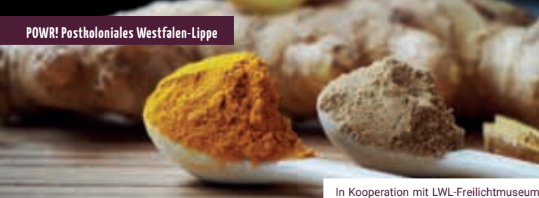
In Kooperation mit LWL-Freilichtmuseum Hagen & dem Eine Welt Netz NRW