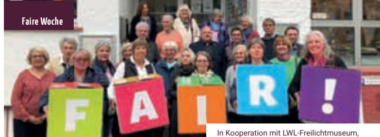
In Kooperation mit LWL-Freilichtmuseum, LWL-Kulturstiftung, POWR, Koloniale Kontinuitäten überwinden, Eine Welt Netz, Exile und vielen anderen.