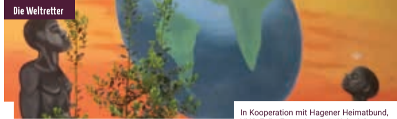
In Kooperation mit Hagener Heimatbund, VHS, Exile, Fernuniversität, Koloniale Kontinuitäten überwinden, LWL-Freilichtmuseum Hagen