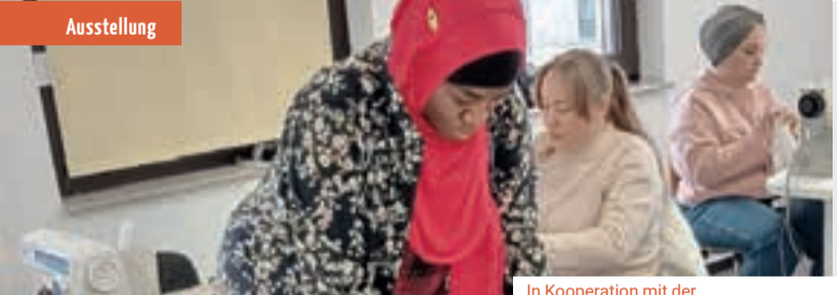
In Kooperation mit der Integrationsagentur der Caritas